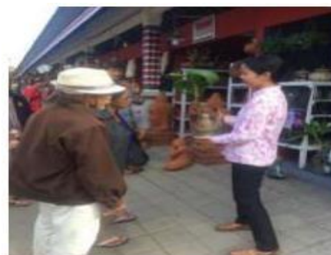
Gambar 2. Pemasaran pada Wisatawan

Peningkatan manajemen dengan memberikan pelatihan jobdesk manajemen perkantoran antara direktur, manajer, business development , staf IT dan helper , pengelolaan keuangan perkantoran termasuk investasi, skala prioritas dan kalkulasi untung rugi, pengoperasian komputer perkantoran ( office ), hingga pemanfaatan modal yang ada agar bisa diputar dan dikembangkan.