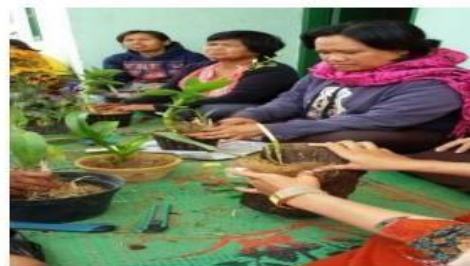
Gambar 1. Pelatihan Manajemen

Disamping itu juga diberikan pelatihan tentang pembuatan pot tanaman, penataan dahan dan ranting, pembuatan pupuk organik, batu taman, rerumputan, dan hidroponik. Jenis tanaman baru seperti anting putri, bonsai beringin jenis iprik, kimeng, kompakta, dan dollar. Ada cemara, anting putri, sakura, putri salju, soka, melati, lohansung, marten, hokiantea, dan masih banyak jenis lainnya yang ada [4].