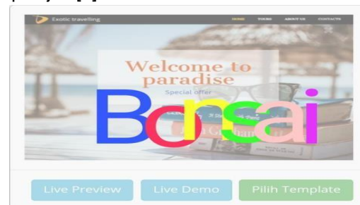
Gambar 4. Pemanfaatan Digital Marketing

Pelatihan bagi kelompok tani dalam membungkus produk yang akan dipasang pada sosmed menjadi tampak menarik dengan penerapan desain grafis sederhana dengan aplikasi yang ada seperti photoshop, onesignal, dan lain-lain yang mudah dipelajari [8].