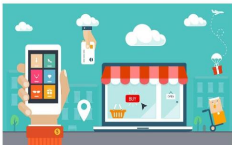
Gambar 5. Sistem Informasi dengan Digital Marketing