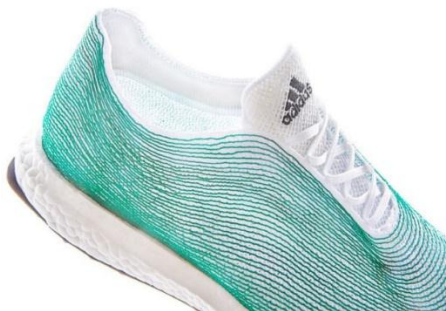
Gambar 11. Sepatu yang terbuat dari daur ulang sampah plastik

Tidak tanggung tanggung, produsen sepatu ternama Adidas telah meluncurkan produk terbaru yang terbuat dari sampah plastik yang diperoleh dari lautan. Sejak tahun 2010, Adidas telah memutuskan untuk tidak menggunakan plastik dalam proses penjualan produk ataupun penggunaan plastik microbeads dalam produk mereka. Sepatu dari sampah plastik ini berbentuk sneaker berwarna biru langit dan telah diluncurkan pada akhir tahun 2015. Ini adalah komitmen dari Adidas dalam upaya mengurangi sampah plastik. Selanjutnya ada beberapa perusahaan sepatu lain yang mengikuti jejak Adidas seperti Rothy's, Timberland, dan Converse.