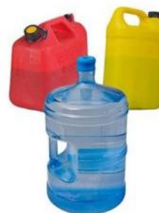
Gambar 8. Plastik jenis Other

Bahan dengan tulisan Other berarti dapat berbahan SAN (styrene acrylonitrile), ABS (acrylonitrile butadiene styrene), PC (polycarbonate), dan Nylon. Polycarbonate, dapat mengeluarkan bahan utamanya yaitu Bisphenol-A ke dalam makanan dan minuman yang berpotensi merusak sistem hormon, mempengaruhi kromosom pada