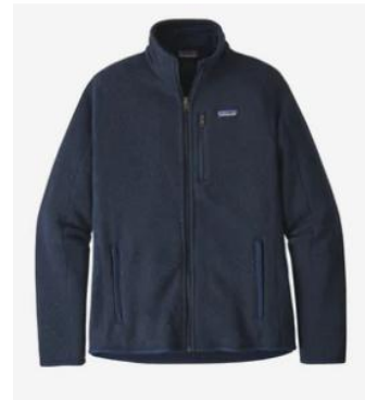
Gambar 12. Jaket dari daur ulang plastik

Patagonia telah berhasil membuat sebuah jaket yang terbuat dari recycling polyester . Material polyester ini dipintal dari botol plastik minuman soda yang diperoleh dari sampah hasil konsumsi masyarakat. Mereka mengklaim bahwa 84% dari produk mereka adalah hasil daur ulang plastik.