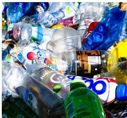
Gambar 9. Timbulan sampah plastik

global menuju masa depan yang bebas dari polusi plastik menunjukkan bahwa penghasil plastik terbesar adalah produk kemasan minuman dan makanan yang sangat sering dikonsumsi oleh masyarakat. Audit dilakukan mulai tanggal 31 Agustus sampai 30 Desember 2020 dengan melibatkan 14.734 relawan dari 55 negara di dunia. Jenis produk yang paling umum ditemui adalah kemasan makanan (bungkus makanan, tutup cangkir kopi, botol minuman) sebanyak 203.427 bagian; bahan-bahan rokok (puntung rokok, korek api, ujung cerutu) sebanyak 72.342 bagian; dan produk rumah tangga (botol deterjen laundry, sampo botol, wadah produk pembersih) sebanyak 21.030 bagian. Dari hasil audit ini, diperoleh 10 pencemar global sebagai penghasil sampah plastik terbesar di dunia yaitu The Coca Cola Company, Pepsico, Nestle, Unilever, Mondelez, Mars, P&G, Philip Morris International, Colgate-Palmolive dan Pervetti Van Melle.