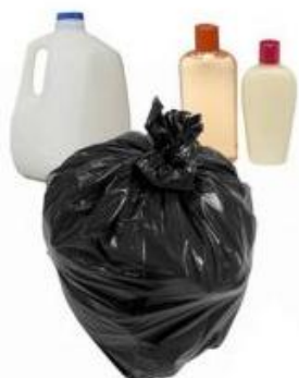
Gambar 3. Plastik jenis HDPE

HDPE memiliki kualitas yang lebih baik dari PET karena memiliki kemampuan mencegah reaksi kimia antara kemasan plastik yang dibentuk dengan bahan ini dengan makanan atau minuman yang dikemasnya. Biasanya digunakan sebagai tempat makanan, wadah shampoo, deterjen, kantong sampah dan lain sebagainya