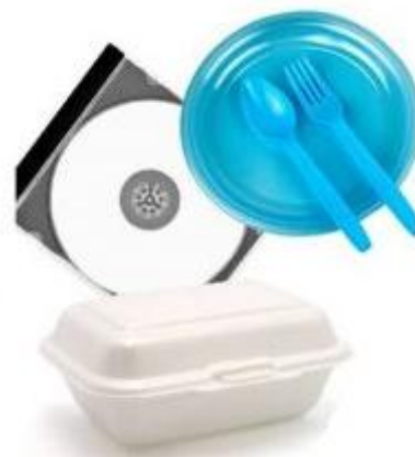
Gambar 7. Plastik jenis PS

masalah reproduksi, pertumbuhan dan sistem syaraf, juga bahan ini sulit didaur ulang. Bila didaur ulang, bahan ini memerlukan proses yang sangat panjang dan lama. Jika tidak tertera kode angka dibawah kemasan plastik, maka bahan ini dapat dikenali dengan cara dibakar (cara terakhir dan sebaiknya dihindari).