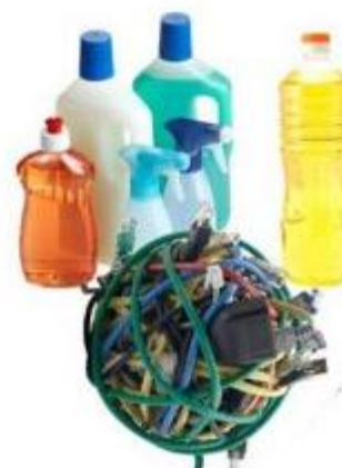
Gambar 4. Plastik jenis PVC

Paling banyak digunakan dalam konstruksi bangunan yaitu pipa dan wadah obat-obatan. Titik leleh PVC ini berkisar antara 70°C sampai 140°C dan dapat bereaksi dengan makanan yang dikemas. Bila plastik jenis ini dipanaskan hingga titik lelehnya, maka DEHA yang terdapat didalamnya akan bereaksi dengan minyak yang ada di makanan dan hal ini akan sangat berbahaya bagi ginjal, hati dan mengakibatkan penurunan berat badan. Jika jenis plastik PVC ini dibakar dapat mengeluarkan racun. Plastik jenis ini juga sangat sulit untuk didaur ulang