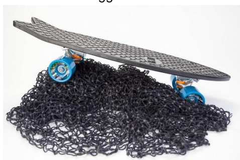
Gambar 15. Skateboard yang terbuat dari limbah jaring nelayan

Merupakan sebuah perusahaan yang berupaya untuk mengolah limbah 82lastic plastik nelayan menjadi barang-barang baru seperti pakaian, kaca mata dan skateboard. Perusahaan ini memiliki misi untuk membersihkan lautan dan melakukan pengolahan terhadap limbah plastik yang mencemari lautan. Disamping itu, mereka juga memberikan banyak informasi kepada masyarakat tentang bagaimana cara mengolah sampah di lingkungan keluarga agar mampu mengurangi timbulan sampah plastik rumah tangga.