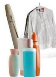
Gambar 5. Plastik jenis LDPE

Plastik jenis ini memiliki sifat kuat, agak tembus cahaya, lebih fleksibel dan memiliki permukaan yang agak berminyak. Dibawah 60°C memiliki resistensi yang baik terhadap senyawa kimia dan uap air namun kurang beradaptasi baik dengan oksigen dan beberapa gas lain. Plastik jenis ini sangat sulit untuk dihancurkan namun telah dapat didaur ulang. Plastik jenis ini sulit bereaksi secara kimiawi dengan makanan atau