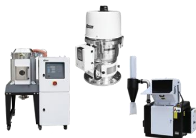
Gambar 14. Peralatan yang dipergunakan oleh Shini USA dalam berproduksi

mengolah limbah plastik sehingga bisa dimanfaatkan sebagai material bahan bangunan dengan kualitas tinggi.