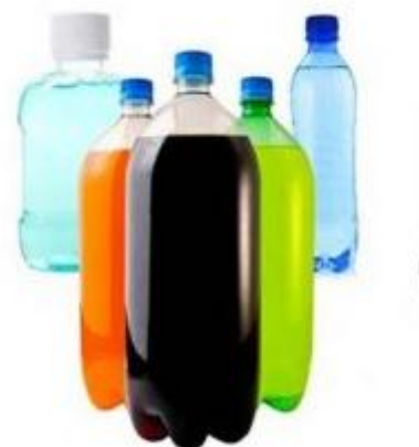
Gambar 2. Jenis plastik PET

PET atau PETE ini umumnya digunakan sebagai bahan pembuatan botol minuman ringan dan tempat makan tahan microwave . 60% bahan plastik PET digunakan sebagai serat sintesis, yang dalam dunia pertekstil disebut sebagai polyester. Selain itu juga digunakan sebagai bahan dasar botol kemasan yaitu sebanyak 30 %. Botol sekali yang hanya sekali pakai ini bila terlalu sering dipakai, dapat mengakibatkan lapisan polimer pada botol meleleh dan mengeluarkan zat karsinogenik yaitu suatu zat yang dapat menimbulkan kanker. Titik lelehnya hanya 85°C dan penggunaan botol ini sebagai botol isi ulang seringkali kita temui di masyarakat. Salah satu material yang digunakan dalam pembuatan PET adalah antimon trioksida, yang berbahaya bagi para pekerja karena zat ini masuk ke dalam tubuh melalui sistem pernafasan, sebagai debu terhirup oleh pekerja. Terkontaminasinya senyawa ini dalam periode yang lama dapat menyebabkan iritasi kulit dan saluran pernafasan. Bagi pekerja wanita, senyawa ini meningkatkan masalah menstruasi dan keguguran, pun bila melahirkan, anak