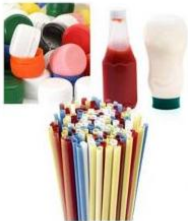
Gambar 6. Plastik jenis PP

PP memiliki titik leleh yang lebih tinggi yaitu 165°C. memiliki warna yang tidak jernih, cukup mengkilap, lebih kuat, ringan, daya tembus uap rendah, tahan terhadap minyak, dan stabil pada suhu tinggi. PP biasanya dikenal dengan kode angka 5. Produk yang menggunakan PP seperti karpet, wadah makanan seperti yoghurt, margarin serta dapat digunakan sebagai botol tempat menyimpan saus, botol obat-obatan, tutup botol, komponen otomotif dan lain sebagainya. Sama hanya dengan LDPE, plastik jenis PP ini termasuk jenis yang aman bagi kesehatan.