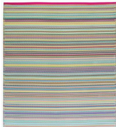
Gambar 13. Karpet dari bahan daur ulang plastik

Adalah sebuah perusahaan yang bergerak dibidang produksi karpet dan segala aksesorisnya yang bersifat ramah lingkungan. Produk mereka terbat dari limbah botol soda. Limbah plastik ini dikominasikan dengan bahan alam seperti kapas dan rami sehingga terbentuklah karpet ramah lingkungan dengan desain dan warna yang menarik.